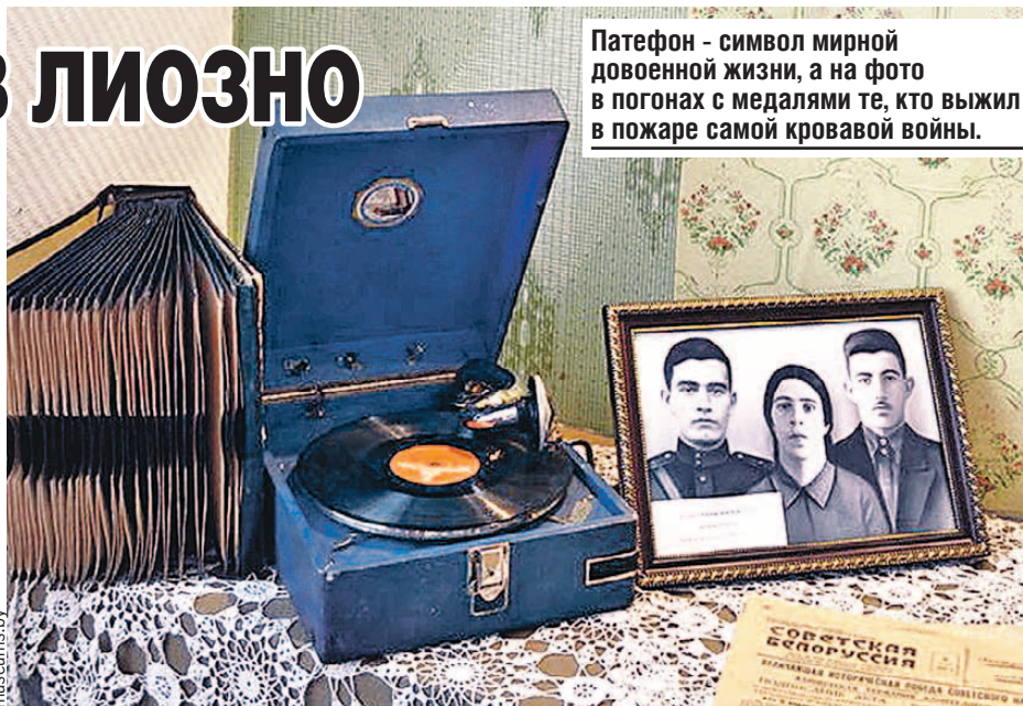
Патефон - символ мирной довоенной жизни, а на фото в погонах с медалями те, кто выжил в пожаре самой кровавой войны.