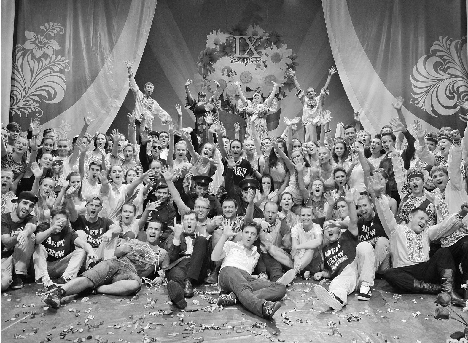
ФОТО КЮРИЯ СТОЖОКА

Вот уже девятый год подряд Ростов-на-Дону становится молодежной столицей Союзного государства. По инициативе и при непосредственном участии депутатов Парламентского Собрания Союза Беларуси и России здесь проводится уже ставший традиционным фестиваль «Молодежь – за Союзное государство». Над Ростовом ярко светит солнце, кружит голову терпкий запах донских цветов и спелых фруктов, а на улицах города и днем, и ночью – сотни веселых, загорелых парней и девушек. Сверкают огнями широкие проспекты, шумит ночная жизнь на левом берегу Дона и отовсюду доносится музыка, музыка и еще раз музыка... Главные песни этого лета звучат в исполнении молодых артистов России, Беларуси, Казахстана. В эти дни молодежная столица нашего Союза вновь, как всегда, радушно и широко принимает гостей и участников фестиваля. Молодые артисты, будущие политики, журналисты, экономисты приехали на этот масштабный молодежный форум, где всегда рождаются новые мысли, идеи, решения, где всегда звучит новая музыка и новые песни. И, конечно же, свершаются новые творческие победы!