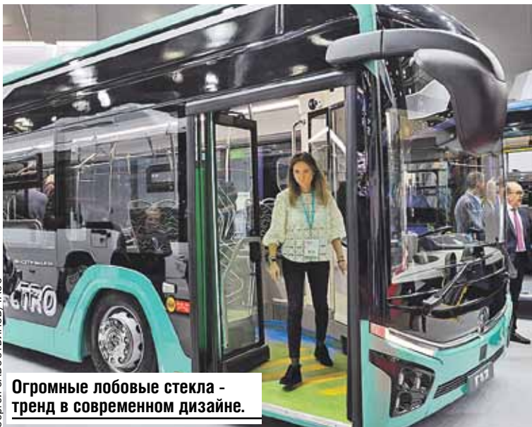
Огромные лобовые стекла - тренд в современном дизайне.