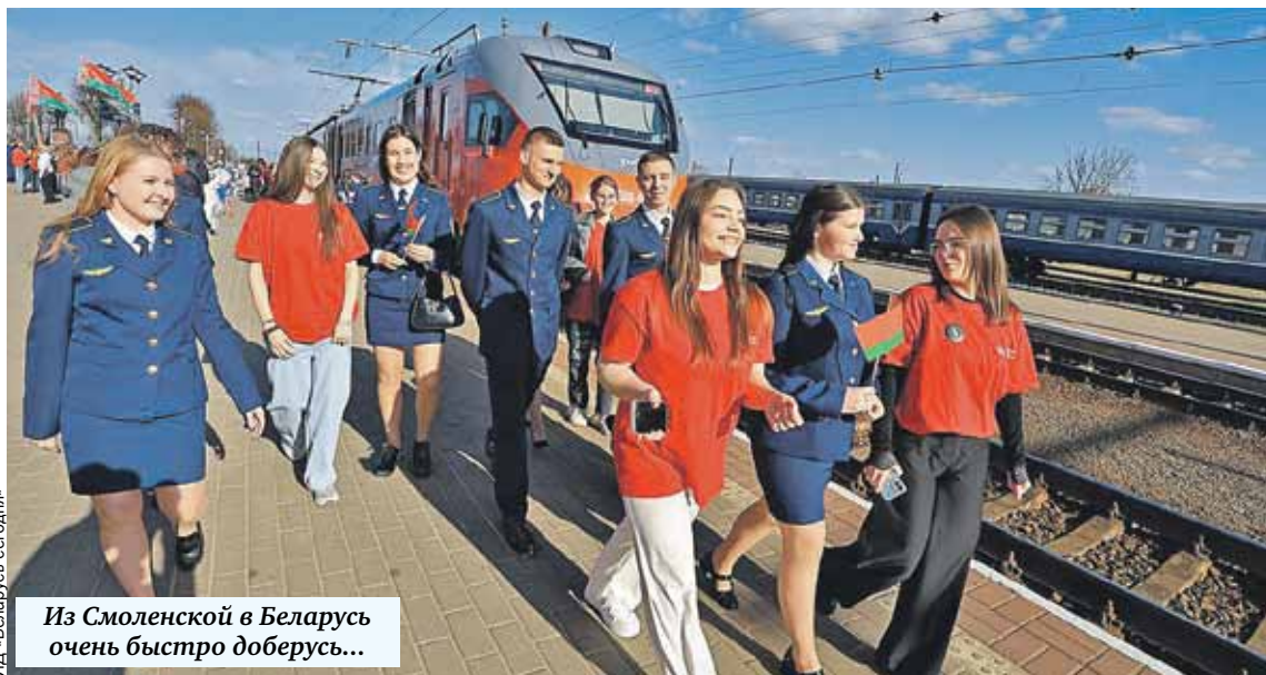
Из Смоленской в Беларусь очень быстро доберусь...

Яркий пример - создание мультибрендового центра «Белорусские машины»