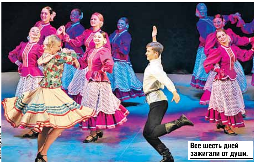
Все шесть дней зажигали от души.

- Несмотря на разницу во времени, всегда на связи, - улыбнулась девушка. - Волнуются, переживают.