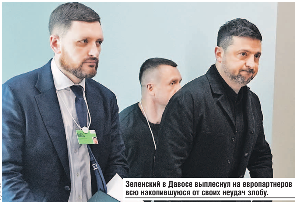
Зеленский в Давосе выплеснул на европартнеров всю накопившуюся от своих неудач злобу.

много работы. Вряд ли возможно дружелюбие на переговорах по Украине, но если они идут, то нужно чего-то пытаться достичь, - прокомментировал пресс-секретарь Кремля Дмитрий Песков.