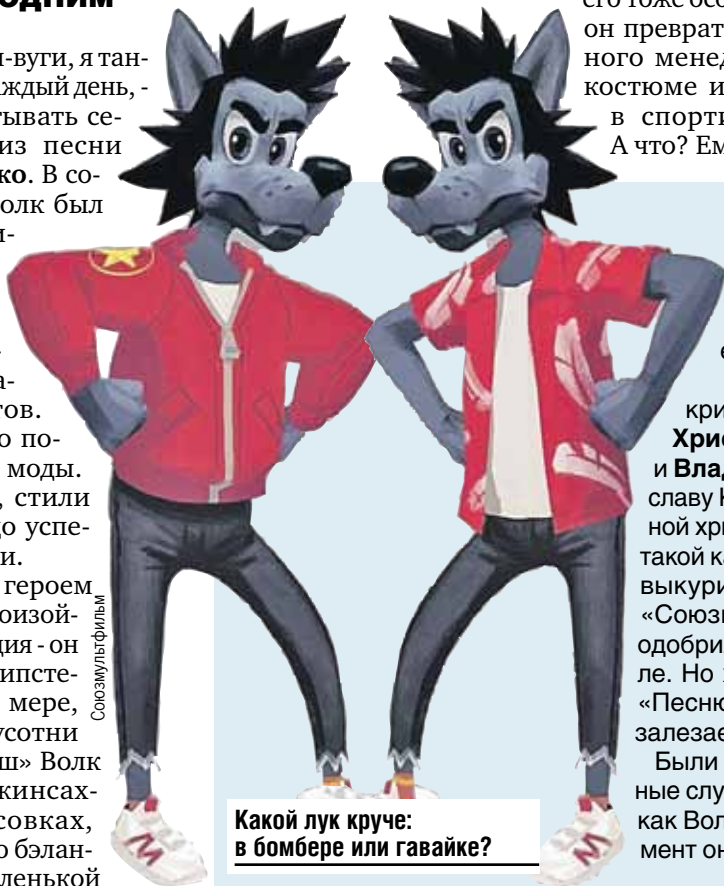
Какой лук круче: в бомбере или гавайке?

Зато изменится графический стиль. Пока аниматоры в поисках, но, кажется, уже нащупали идею - хотят попробовать квази-3D-технику.