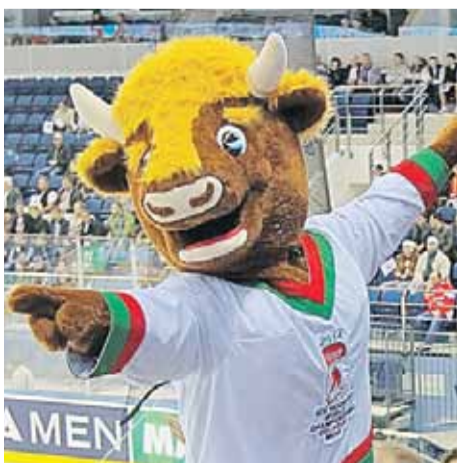
Зубр Волат - талисман ЧМ-2014 - сразу полюбился болельщикам.

Александр Якушев родился в 1947 году в Балашихе. Заслуженный мастер спорта, заслуженный тренер СССР. Двукратный олимпийский чемпион, семикратный чемпион мира. Трехкратный чемпион СССР в составе московского «Спартака». Президент Ночной хоккейной лиги.