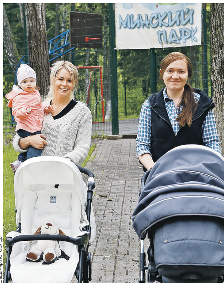
Строители подарили городу зеленый парк, который стал частью жилого комплекса «Малиновка».