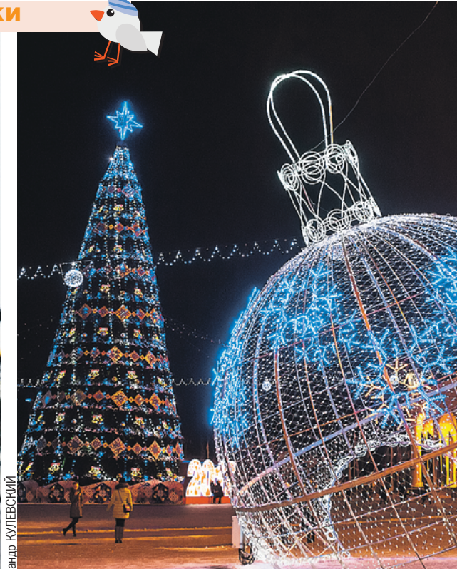
Минск. Огни на 34-метровой красавице на Октябрьской площади зажгли еще 15 декабря. Символ праздника собрали на металлическом каркасе из трех тысяч (!) маленьких елочек.