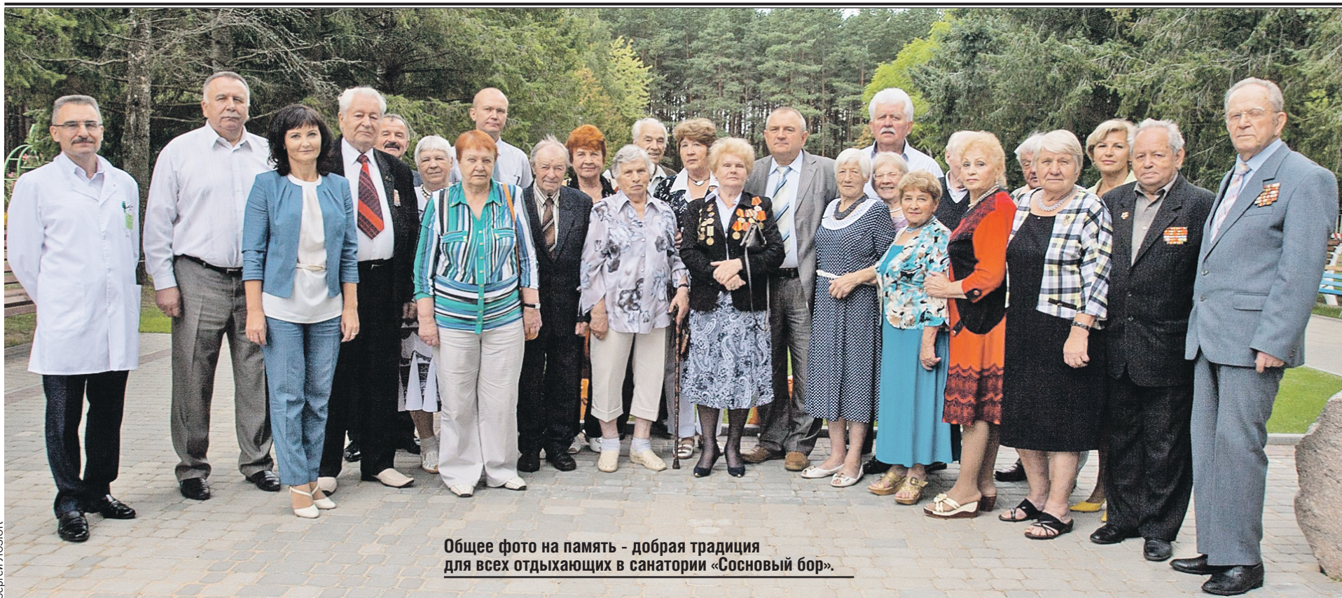
Общее фото на память - добрая традиция для всех отдыхающих в санатории «Сосновый бор».