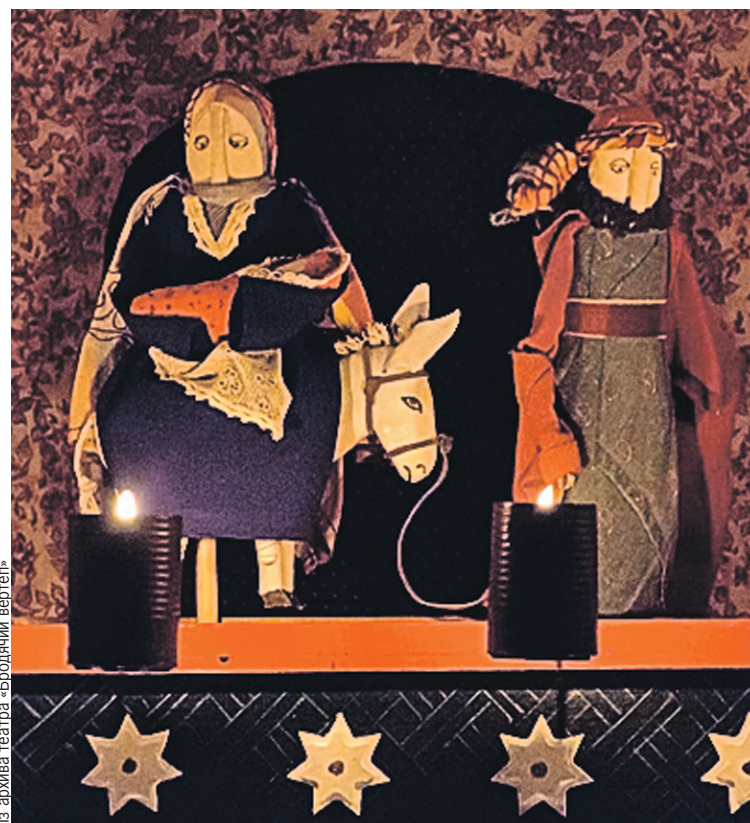
В рождественской истории куклы - как люди.

таких театров в республике с каждым днем становится все больше.