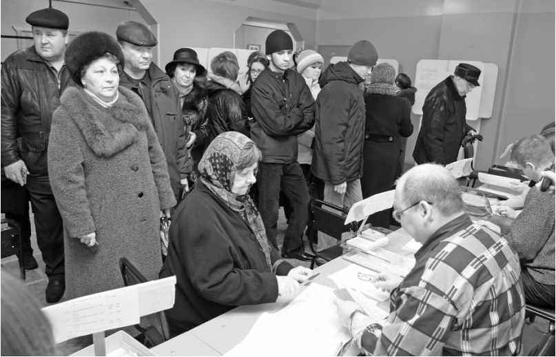
На избирательном участке

считает, что выборы были транспарентными и обеспечили свободное волеизъявление избирателей.