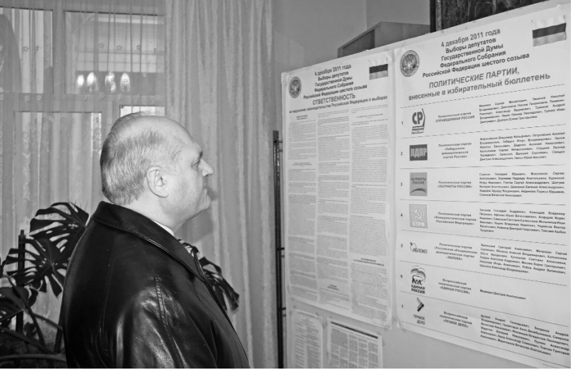
А.А. Попков. Смоленск, Смоленская обл.