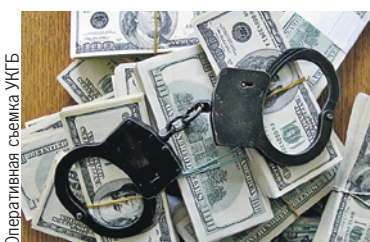
Оперативная съемка УКБ

Как в России и Беларуси борются с коррупцией