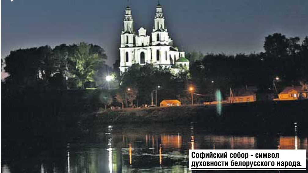
Софийский собор - символ духовности белорусского народа.

Город на Западной Двине - один из древнейших у восточных славян